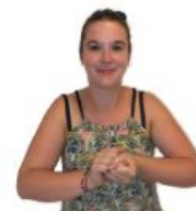
CHANGER LA COUCHE