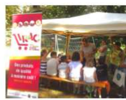
Oasis de Carriet en fête