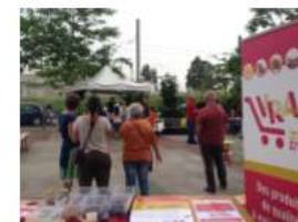
Fête des voisins