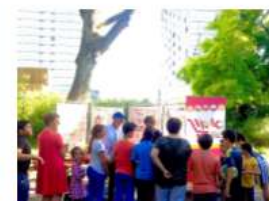
Place publique d'été