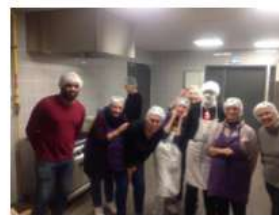
Atelier cuisine Halloween