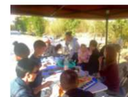
Goûter aux Akennes