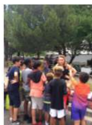
Fête des Alpilles