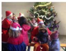
Noël aux Akennes