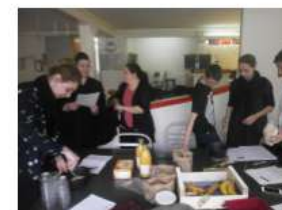
Atelier fabrication barres de céréales